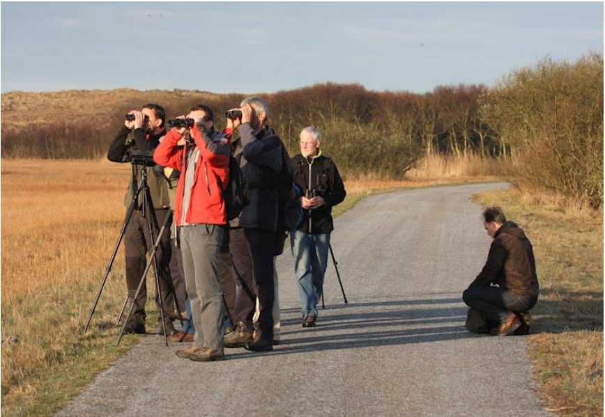
Fitis (boven); excusie Zwanenwater (onder)